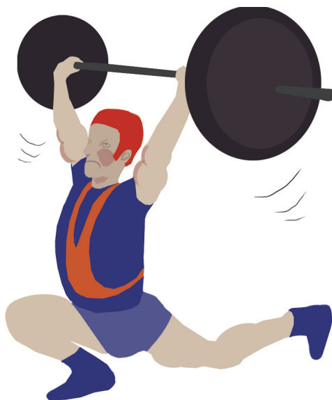
Vægtløfter der holder en stang over hovedet