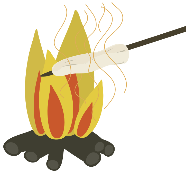
Snobrød over bål