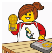
Del din løsning med andre.

Du kan se et eksempel på workshoppen her: youtube.com/watch?v=Q6_laT1Ohks